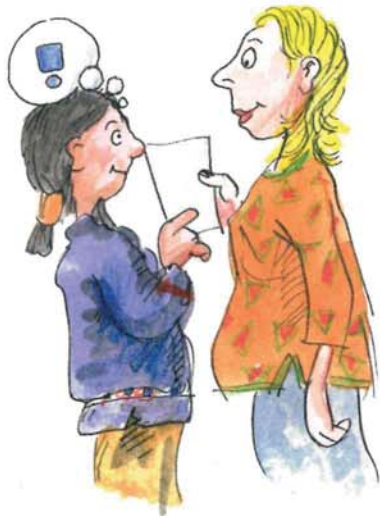
Im Dialog – erzählen und Fragen stellen

Das Programm Rucksack Schule richtet sich kostenfrei an Eltern und ihre Kinder vom ersten bis zum vierten Schuljahr sowie an die Grundschulen. Kinder sollten auf dem Weg zum Schul- und Bildungserfolg von den Eltern unterstützt und begleitet werden (Hausaufgaben, Lesen, gemeinsame Aktivitäten usw.) Die Landeshauptstadt Hannover ermöglicht deshalb in enger Zusammenarbeit mit vielen Grundschulen allen Eltern und Kindern die Sprachkompetenz, Mehrsprachigkeit und Interkulturalität zu fördern.