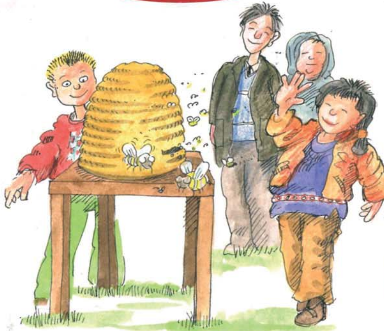
Ausflüge zu außerschulischen Lernorten z. B. Besuch im Schulbiologiezentrum