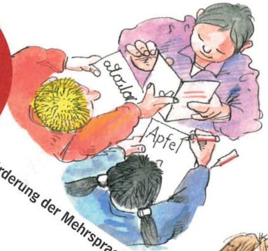
Förderung der Mehrsprachigkeit