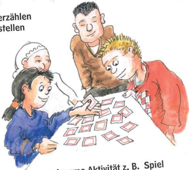
gemeinsame Aktivität z. B. Spiel